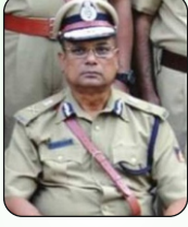
ಶ್ರೀ ಸುಶಾಂತ್ ಮಹಾಪಾತ್ರ, ಐ.ಪಿ.ಎಸ್.(ಎ) ಪೊಲೀಸ್ ಮಹಾನಿರ್ದೇಶಕರು

ಶ್ರೀಯುತರು ದಿ: 25.12.56 ರಂದು ಜನನ ಹೊಂದಿರುತ್ತಾರೆ. ದಿನಾಂಕ: 27.07.79 ರಂದು ಭಾರತೀಯ ಸೇವೆಗೆ ನೇರವಾಗಿ ಆಯ್ಕೆಯಾಗಿರುತ್ತಾರೆ. ಇವರು ವಿವಿಧ ದರ್ಜೆಗಳಿಗೆ ಮುಂಬಡ್ತಿ ಹೊಂದಿ ದಿನಾಂಕ: 31.12.2016 ರಂದು ಡೈರೆಕ್ಟರ್ ಜನರಲ್ ಆಫ್ ಪೊಲೀಸ್ & ಫೀರ್ಮನ್, ಕರ್ನಾಟಕ ಪೊಲೀಸ್ ಹೌಸಿಂಗ್ ಕಾರ್ಪೊರೇಷನ್, ಬೆಂಗಳೂರು ಹುದ್ದೆಯಲ್ಲಿ ಸೇವೆಯಿಂದ ವಯೋ ನಿವೃತ್ತಿ ಹೊಂದಿರುತ್ತಾರೆ. ಇವರು ಅನಾರೋಗ್ಯದಿಂದ ದಿನಾಂಕ: 17/07/2020 ರಂದು ಮೃತಪಟ್ಟಿರುತ್ತಾರೆ. ಭಗವಂತನು ಅವರ ಆತ್ಮಕ್ಕೆ ಶಾಂತಿಯನ್ನು ಕರುಣಿಸಲೆಂದು ಪ್ರಾರ್ಥಿಸುತ್ತೇವೆ.